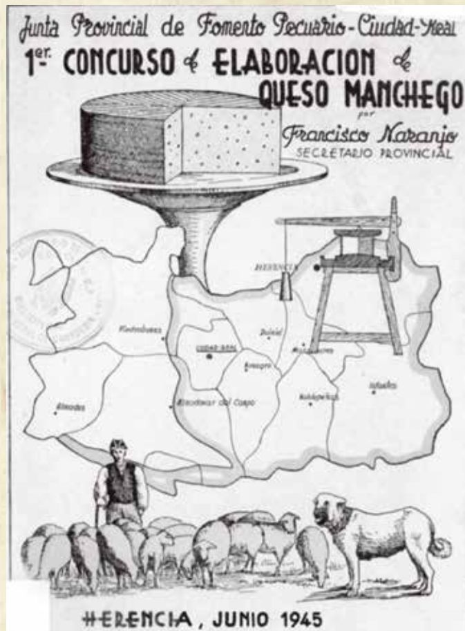
Figura 5. Portada de la memoria y reglamento del primer concurso de elaboración de Queso Manchego que se celebró en Herencia (1945).