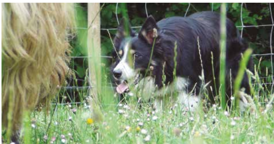
Primer plano de Border Collie.

No existe una raza de perros de pastor ni un individuo que, a priori, se adecúe o adapte, 100%, a tu día a día. Y, mucho menos, sin esfuerzo. Más bien, eres tú quien debes aprender a utilizar ese ejemplar de esa raza concreta que, con sus limitaciones, te va a ayudar, con seguridad, en tu trabajo diario. Si te haces con una genética “decente”, aprendes un sistema de trabajo, cuidas las condiciones y le das tiempo a crecer (en todos los sentidos), tendrás siem-