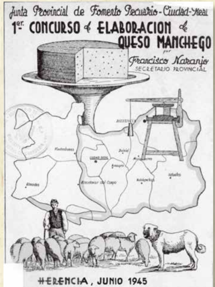
Figura 5. Portada de la memoria y reglamento del primer concurso de elaboración de Queso Manchego que se celebró en Herencia (1945).