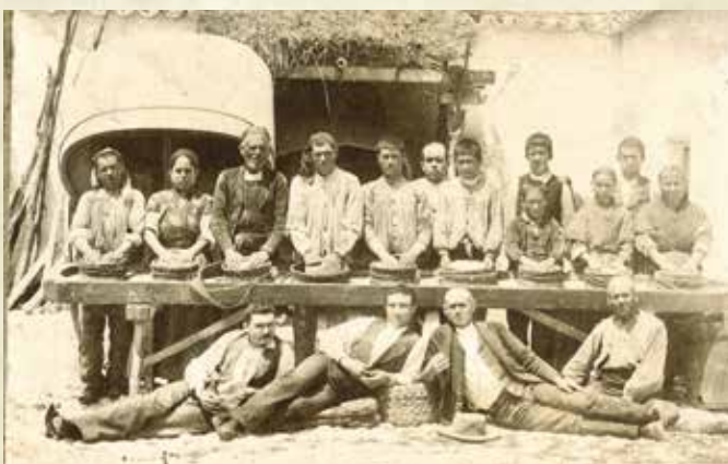
Figura 1. Finca Los Arenales finales del siglo XIX. Sin duda la ocasión animó a grandes y pequeños, mujeres y hombres. Resalta la indumentaria más rica del mayoral y mayordomo, terceros por la izquierda de la fila superior e inferior.

En época más recientes, primer tercio del siglo XX hay diversas referencias de solicitud de permisos para la venta e incluso exportación de queso en la localidad de Herencia, lo que da idea del nivel del sector transformador y comercial. Estas iniciativas contaron con el apoyo técnico de un ilustre herenciano, D. Calixto Moraleda, promotor de la Estación Pecuaria de Ciudad Real a partir de la cual desarrolló una imponente labor que incluyó la formación del actual Rebaño Nacional (por supuesto con animales de origen herenciano), la creación de la "Escuela de Queseros Artesanos" y numerosos estudios y cursos dirigidos a ganaderos y queseros. Podemos hacernos una idea de la forma de trabajar en los