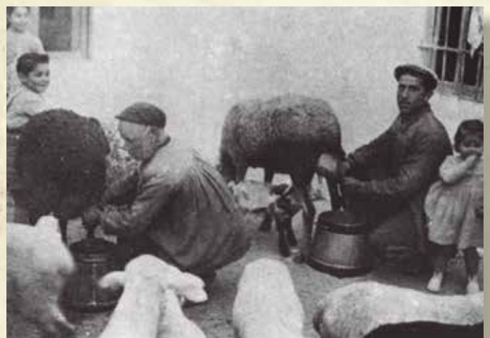
Figura 3. Ordeño manual. Obsérvese la presencia de corderos, las blusas y la postura para realizar la faena.