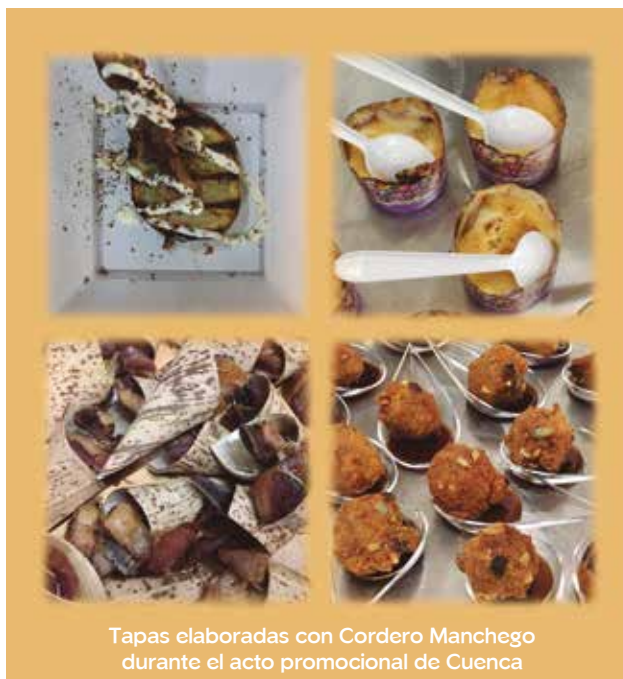
Tapas elaboradas con Cordero Manchego durante el acto promocional de Cuenca