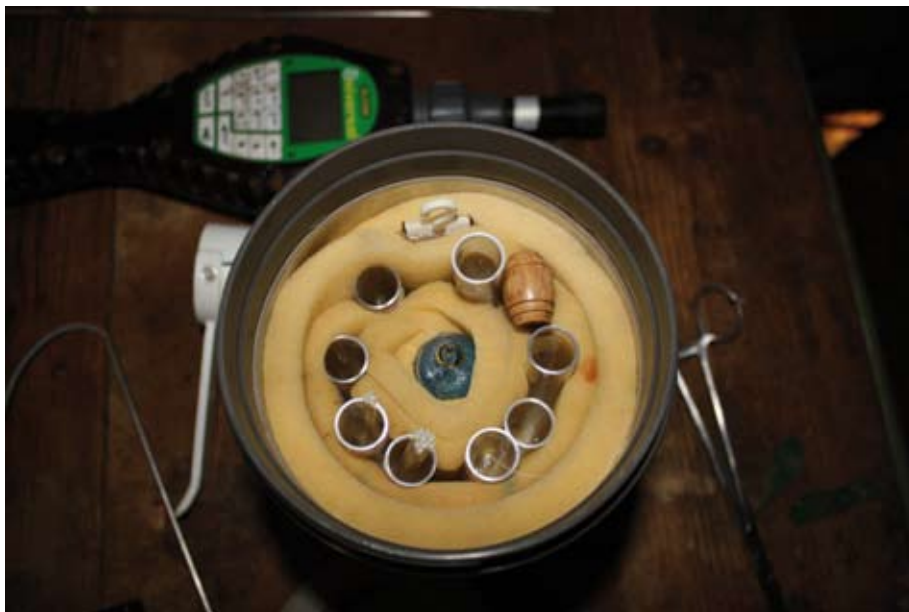
En esta imagen del interior del termo se puede observar la banda de goma espuma de poliuretano, alrededor de la que se disponen las dosis seminales, y la ampolla de ácido acético que, colocada en el centro, permite que la temperatura en el interior del termo se mantenga entre 15 y 16° C.

En Roquefort, las ovejas Lacaune no se ordeñan inmediatamente después de la IA, debido a que durante el ordeño