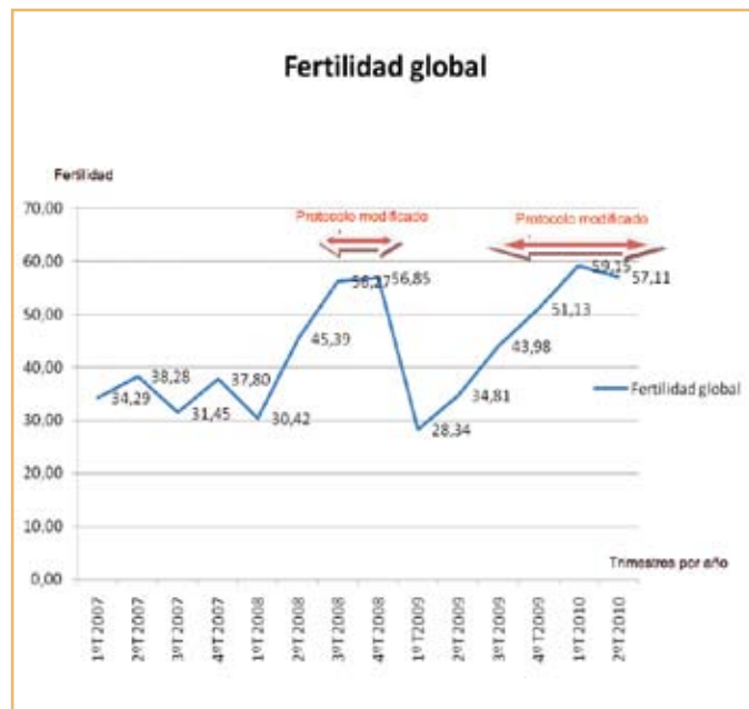
Gráfico 1: Aumento de la fertilidad entre 2007-2010 en los periodos de aplicación del protocolo de IA modificado.

Entre 2008 y 2010, en el periodo comprendido entre julio y diciembre de 2008 por un lado, y entre julio de 2009 y junio de 2010 por otro, obtuvimos 1.630 partos de 2965 inseminaciones, lo que corresponde a una fertilidad media de 54,4% . En época desfavorable de anestro estacional (primer semestre 2010), obtuvimos 583 partos de 1000 inseminaciones (58,3% de fertilidad) y en época favorable de reproducción ovina (2º semestre 2008 y 2º semestre 2009) logramos 1.115 partos de 2.121 inseminaciones, es decir una fertilidad igual a 52,5%. Estos resultados están casi 20 puntos por encima del año anterior (2007) : donde se realizaron 4.212 inseminaciones y parieron 1.481 animales (35% fertilidad).