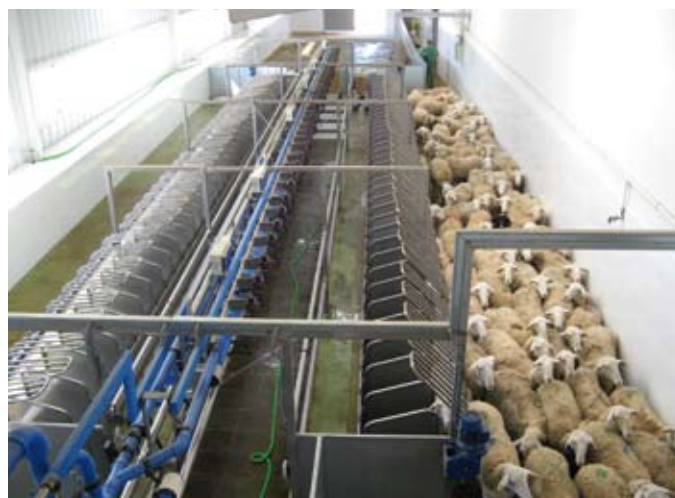
La mejora de infraestructuras e instalaciones es una de las líneas que se contemplan en la Estrategia Regional para la Ganadería.

2. OBJETIVO Nº 2: Acceso telemático a la Web de la Consejería de Agricultura y Medio Ambiente para facilitar los trámites al sector ganadero. Presupuesto Total (2010-2015): 1.200.000 €