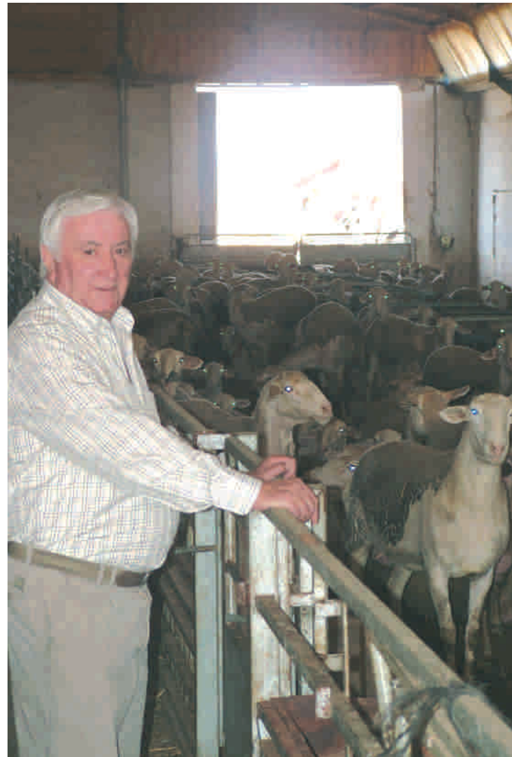
Aquí vemos al Presidente de Agrama, en una de las naves de los animales.